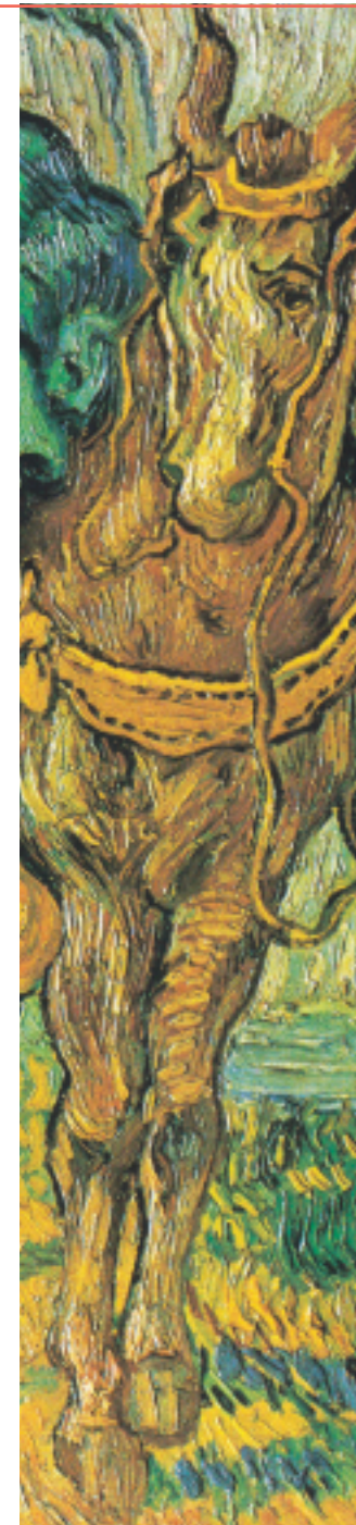
Vincent Van Gogh, 1890, d'après Le bon samaritain d'Eugène Delacroix (détail), Kröller-Müller Museum

Au 20 e siècle, l'espèce animale fait désormais partie intégrante de la société, elle vit avec les êtres humains. Nous leur accordons des droits, nous reconnaissons leurs sentiments et apprenons à les comprendre. Tout ceci aura un impact sur l'art animalier, puisque la faune sera de plus en plus présente au sein des différents arts. Depuis une cinquantaine d'années, l'art contemporain développe une antithèse de la sacralisation de l'animal des temps anciens, et exprime peut-être le regret du lien vital, de notre humanité.