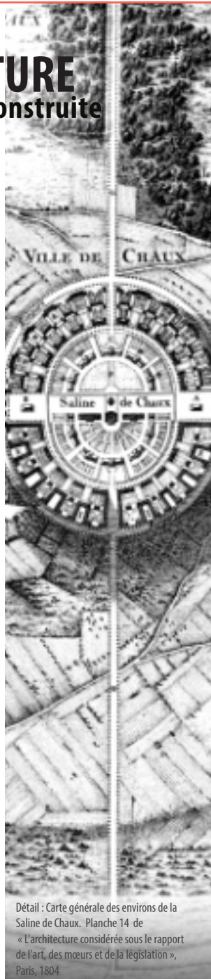
Détail : Carte générale des environs de la Saline de Chaux. Planche 14 de « L'architecture considérée sous le rapport de l'art, des mœurs et de la législation », Paris, 1804

De la tour de Babel de Bruegel à Métropolis de Fritz Lang, les utopies architecturales n'ont cessé de stimuler l'univers visuel et visionnaire des peintres et des cinéastes. C'est dans la bande dessinée, avec les cités obscures de Schuiten, que l'utopie s'épanouit, entre mirage et fantasmagorie pour recréer des capitales comme Paris et Bruxelles, dans des univers parallèles, entre nostalgie et exaltation du futur.