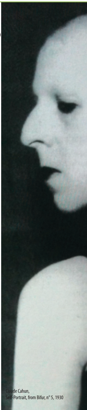
Claude Cahun, Self-Portrait, from Bifur, n° 5, 1930

Depuis la période classique, aux artistes femmes étaient réservés les tableaux de bouquets de fleurs, le portrait de mères et d'enfants. Au 20 e siècle apparaissent des personnalités singulières privilégiant à ces poncifs une position décalée. Ainsi, progressivement, alors qu'elles étaient globalement absente de l'histoire de l'art, les artistes femmes se sont réapproprié dans les décennies suivantes leur image, leur vécu et leur identité. Nous suivrons cette exaltante conquête en nous appuyant sur des figures féminines et féministes majeures qui ont imposé une perception et une créativité "femme".