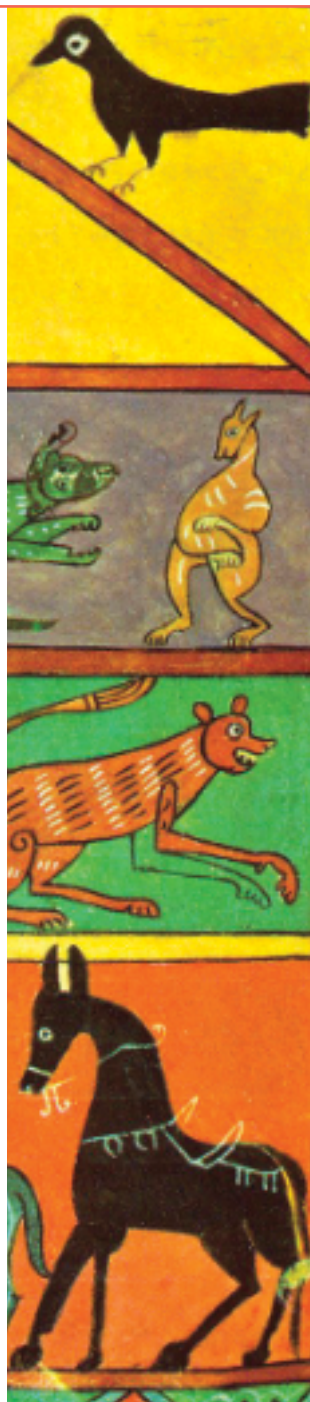
Enluminure sur parchemin, L'Arche de Noé , c. 975 Archives de la Seu d'Urgell

L'art animalier du Moyen-Âge, allant du 5 e au 15 e siècles, est caractéristique de la société de l'époque : la relation entre l'Homme et Dieu. La majorité des œuvres sont influencées par le christianisme, servant pour ornement ou décoration pour la classe sociale supérieure (la royauté). L'ours et le cerf sont des exemples d'animaux qui représentaient toute une symbolique entre l'univers du paradis et celui plus terrestre. La licorne faisait partie d'un des animaux caractéristiques de l'art médiéval : elle était liée à la femme, la musique, la poésie et la trahison du Christ.