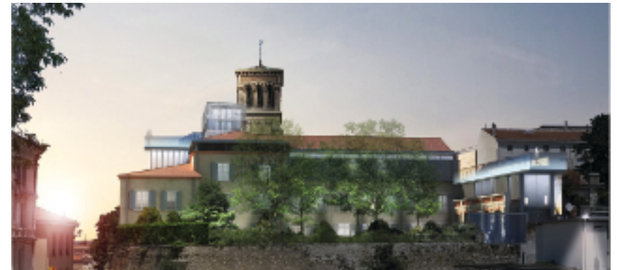
Valence, vue perspective du projet d'extension (DR J.-P. Philippon)

Livré en 2013 et unanimement salué par la critique et le public, le projet de rénovation-extension du musée des beaux-arts et d'archéologie témoigne de la démarche distinctive de Jean-Paul Phillippon, composant avec le déjà-là, avec les strates de l'histoire et avec l'esprit des lieux afin de les magnifier par l'architecture contemporaine. Cette conférence permettra d'apprécier la délicatesse et la justesse de cette démarche à l'aune de quatre réalisations ayant marqué le parcours de l'architecte : le Musée d'Orsay à Paris (1979-1986), le Musée des Beaux-Arts de Quimper (1989-1993), la Piscine de Roubaix (1994-2001) et l'École nationale supérieure d'architecture de Paris-Belleville (2002-2009).