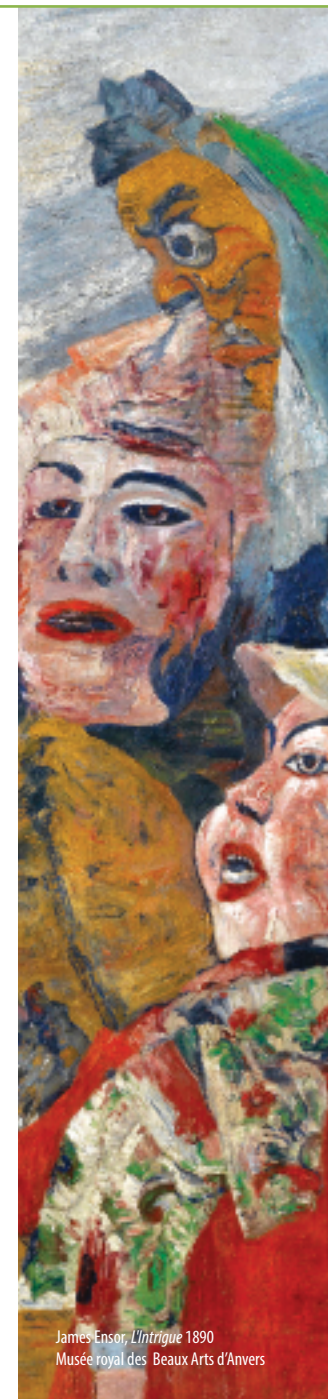
James Ensor, L'Intrigue 1890 Musée royal des Beaux Arts d'Anvers

Les écarts qu'ont effectué leurs prédécesseurs sont-ils encore effectifs chez les artistes contemporains belges ? Ou, au final, l'originalité de chacun ou chacune est-elle absorbée par ce 4ème pilier de la mondialisation néo-libérale qu'est devenu l'Art Contemporain ?