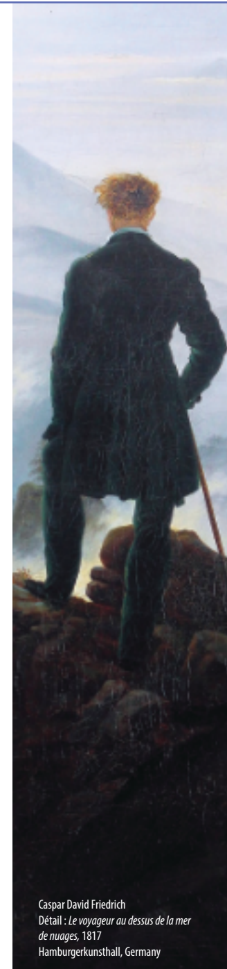
Caspar David Friedrich Détail : Le voyageur au dessus de la mer de nuages , 1817 Hamburgerkunsthall, Germany

La Nature transformée par les visions des artistes... et artistes en « métamorphoses ». Un parcours/dédale du 16 e siècle à la création contemporaine pour y rencontrer cette « sidération » du regard. Enigmes visuelles des « figures » cachées dans les paysages anthropomorphes aux paysages-portraits d'Arcimboldo, nous croiserons d'étranges anatomies paysagères : Homme/végétal, Homme/minéral. Mirages esthétiques comme projection de fantômes, ce seront des transitions perpétuelles au sein de la lancinante question métaphysique de la place de l'homme dans l'univers.