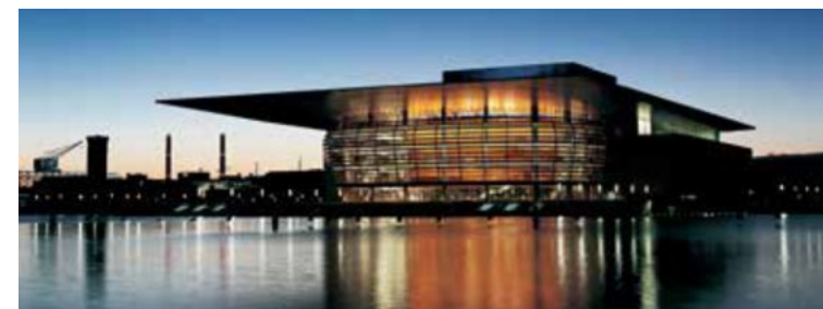
The Royal Danish Opera Copenhagen (2005) Cabinet d'architecture Henning Larsen

Le paysage culturel de Copenhague connaît depuis vingt ans une complète métamorphose. Les musées ont donné le ton avec l'extension contemporaine de la Ny Carlsberg Glyptotek (1996), suivie par les agrandissements du Musée national des Beaux-Arts (1998) et du musée Orduggaard (2005 et 2008). København Havn, le « grand canal » de Copenhague, a connu des transformations plus radicales encore. La nouvelle Bibliothèque nationale - surnommée le « Diamant noir », le Théâtre royal danois et l'Opéra s'affichent, ostentatoires, là où se trouvaient naguère entrepôts et friches industrielles. Les quais devraient accueillir un nouveau centre culturel et aquatique confié à l'architecte Kengo Kuma.