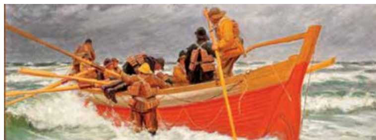
Détail : The red rescue boat on it's way out (1920) Michael Ancher

Le géographe Georges Chabot écrivait : « Il est remarquable que les données naturelles et humaines concordent pour faire de la Scandinavie, une région à part, une des mieux individualisées d'Europe ». Dans la tempête artistique qui a fait que peinture et sculpture occidentales se reconfigurent entièrement à partir du XIX e siècle, comment 4 individus, 4 personnes singulières, le Norvégien Edvard Munch, le Suédois Erik Dietman, les Danois Per Kirkeby et Olafur Eliasson ont-ils traversé ces 150 ans de bouleversement qui ont fait passer l'art du rigide classicisme au désordre contemporain