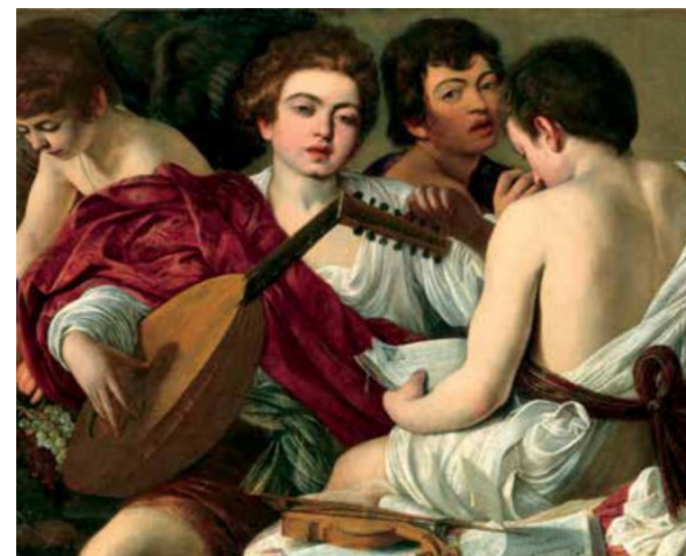
Les musiciens (1596-97) Michelangelo Merisi dit Caravaggio New-York, M. M. A. Roger Funds 1952

Les jeunes peintres français arrivant à Rome à partir de 1610 sont tout autant marqués par Caravage que sensibles à la lecture codifiée qu'en donne Bartolomeo Manfredi, décrite dès la fin du siècle sous le nom de Manfrediana Methodus. Simon Vouet en tête, la plupart d'entre eux développent une version adoucie des formules caravagesques, empreinte d'une élégance parfois précieuse, avec laquelle contraste toutefois l'esprit d'un Valentin de Boulogne ou d'un Nicolas Tournier.