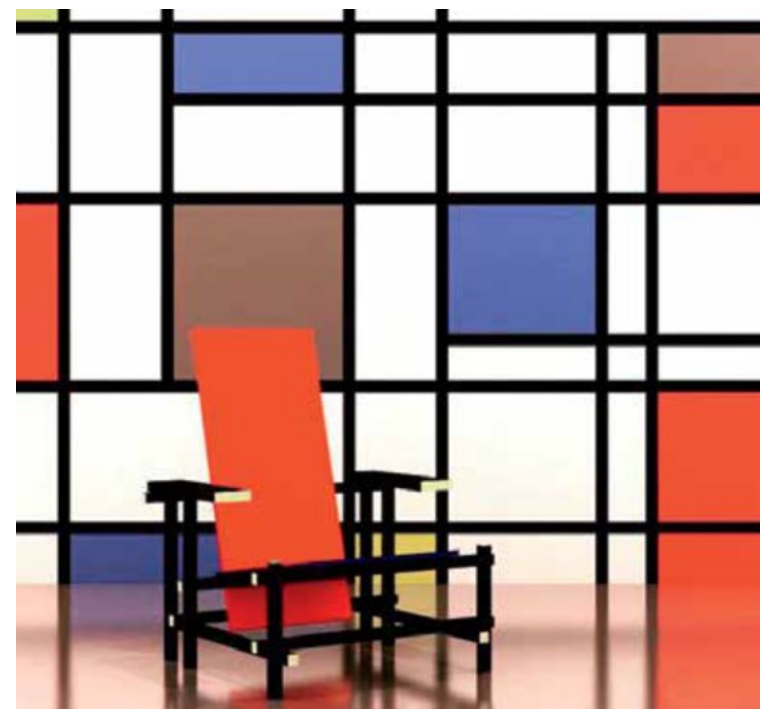
La chaise rouge et bleue (version colorée 1923). Gerrit Rietveld

Susceptible de faciliter la compréhension, de résoudre des problèmes d'identification et de faire émerger cohérence et clarté du désordre, le design graphique est souvent défini par sa capacité à rationaliser informations et connaissances. Divers exemples polémiques ou discutés, choisis dans les domaines de l'édition imprimée, de l'identité visuelle ou de la publication numérique pourraient bien au contraire nous détromper : la pratique du design graphique s'accompagne de tensions dont l'analyse révèle des relations souvent contraires et parfois conflictuelles.