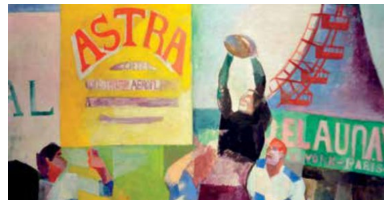
Détail : L'équipe de Cardiff (1912-13) Robert Delaunay

Cette conférence traitera exclusivement du football, sport roi, grand inspirateur des artistes tel Nicolas de Staël et ses Footballeurs du Parc des Princes en 1952. Le ballon rond et ses multiples événements parfois planétaires offrent dès la fin du XIXe siècle de multiples occasions aux artistes, parfois réfractaires mais souvent totalement conquis, de laisser libre cours à leur inspiration pour mettre en scène ces gladiateurs des temps modernes, jusque même au fameux Coup de boule de Zinedine Zidane en 2006 sculpté par Adel Abdessemed quelques années plus tard dont il sera question.