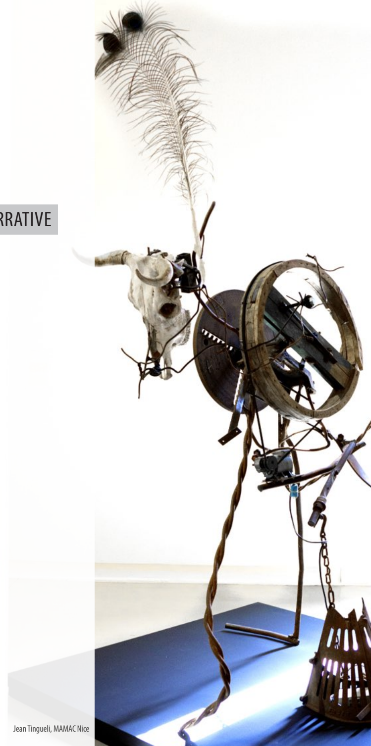
Jean Tinguely, MAMAC Nice