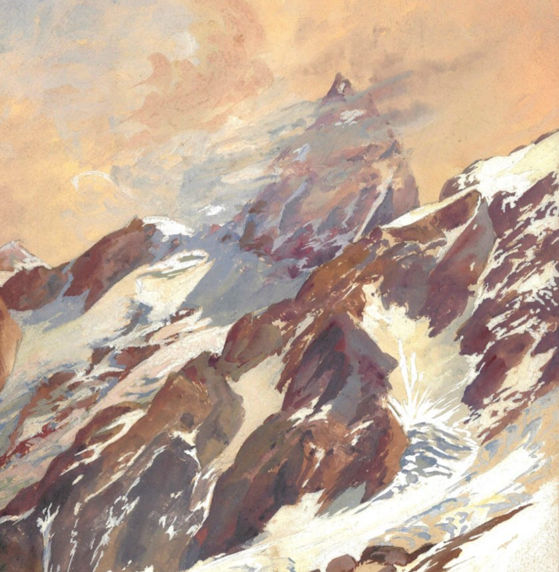
Théophile-Jean Delaye. Détail : Du Col de Paccave Les Enfethores et la Meije . Non daté. Gouache sur papier cartonné. 32,3 x 21,8 cm