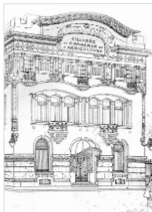
Croquis de la façade de la Chambre de commerce par l'architecte Louis Bozon © Fonds Louis Bozon

Cette conférence (gratuite) sera suivie de l'assemblée générale de l'association.