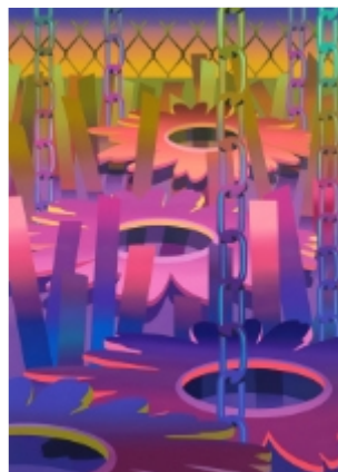
Amélie Bertrand, Hyper Nuit, yellow , 2024, huile sur toile, 180 x 130 cm, courtesy Semiose, Paris © A. Mole, courtesy Semiose, Paris © Adagp, Paris, 2026

Le vocabulaire d'Amélie Bertrand se compose de motifs trouvés sur internet que chacun peut appréhender aisément. Elle les combine pour inventer des « espaces crédibles » dont l'existence reste néanmoins uniquement picturale. Les fleurs, les piscines ou les nénuphars deviennent des formes normalisées au cœur d'une réflexion semblable à celle énoncée par Monet : « Le motif est quelque chose de secondaire, ce que je veux reproduire, c'est ce qu'il y a entre le motif et moi ». Ses paysages, toujours étranges, baignent dans une atmosphère provoquant une sensation de mirage qui suscite souvent le malaise.